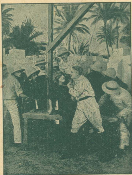
Den uskyldige reddes.