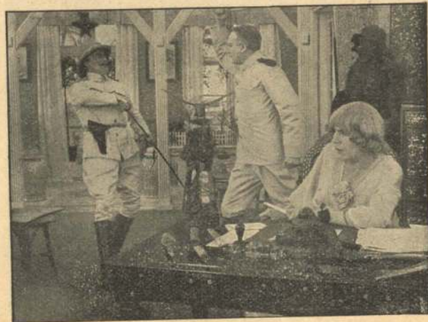
Lokket i Falden.

Netop paa samme Tid modtager Obersten en vigtig Depeche: