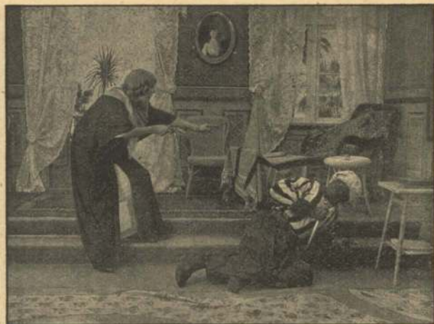
Den sorte Forrader.

Obersten, der kommanderer Tropperne i Grænse-distriktet, faar nu andet at tænke paa end Halvbrode-rens Trusler.