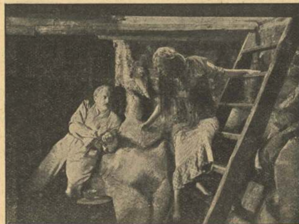
Den indfødte Spaakvindes Offer.

Sparre skriver straks et glødende Brev til Fru Yelva og beder hende om endnu et Møde. Den aarvaagne Carol finder Brevet, og kort efter