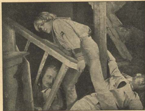
Carol befrier sin Fader.

Sparre og Tjeneren er imidlertid ubemærket sluppet tilbage til Lejren, og uden at føle Samvittighedsnag