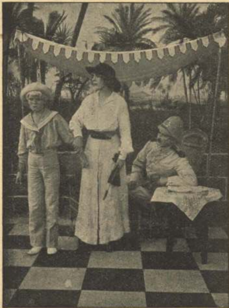
Carols Mistro til Moderen.

Oberst Bjelke er stadig ikke lykkelig, og til hans øvrige Sorger kommer nu ogsaa et Brev, der meddeler, at hans Halvbroder, Richard Bøhme, er løsladt af Fængslet og er rejst for at opsøge ham.